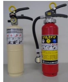
しょうかき 消火器