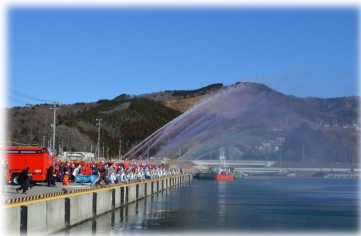
女川町消防出初式