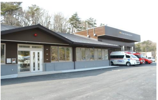
東松島消防署鳴瀬出張所

敷地面積 1,637.75 m 2 建築 昭和47年度 庁舎構造 鉄筋コンクリート造平屋建 570.62 m 2