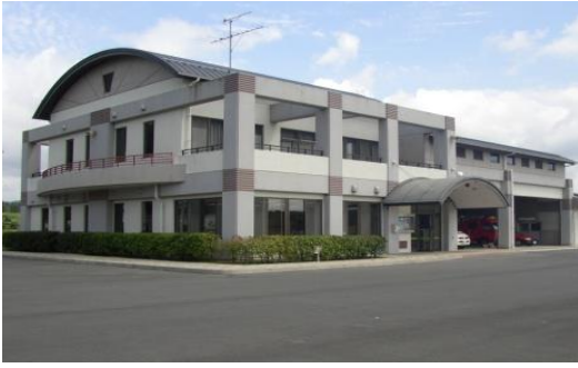
河北消防署桃生出張所