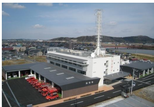
消防本部・石巻消防署