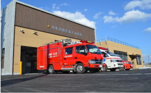
河北消防署北上出張所

敷地面積 3,364.73 m 2 建築 平成10年度 庁舎構造 鉄筋コンクリート造2階建 810.00 m 2