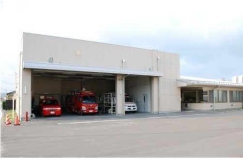
石巻消防署河南出張所