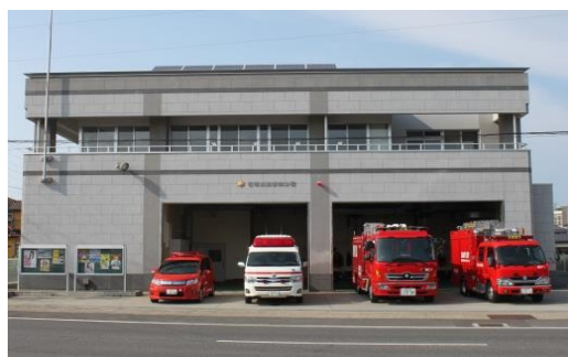
石巻消防署南分署