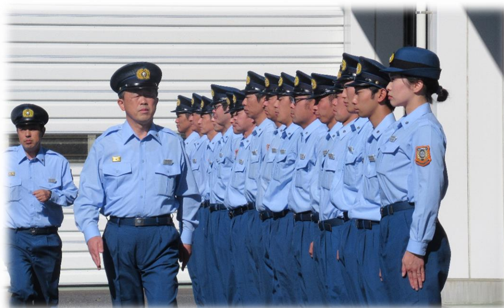
上段：女性活躍推進研修会（宮城県内）