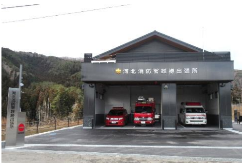
河北消防署雄勝出張所

敷地面積 930.40 m 2 建築 昭和47年度(増築 平成13年度) 庁舎構造 鉄筋コンクリート造2階建 727.24 m 2