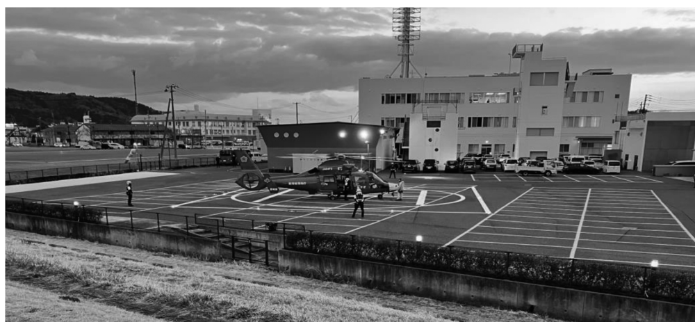
宮城県防災ヘリコプター夜間離着陸訓練 令和6年3月7日 於：石巻広域消防本部ヘリポート