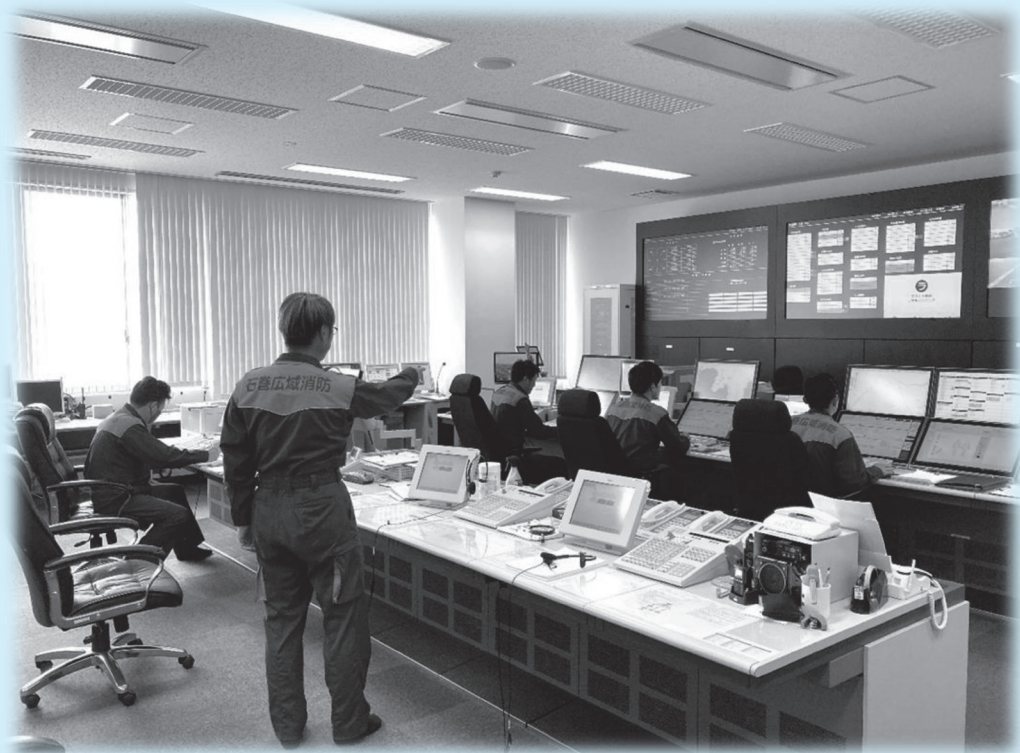
消防指令センター