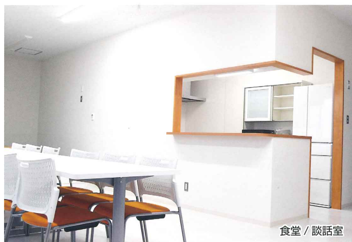
食堂 / 談話室