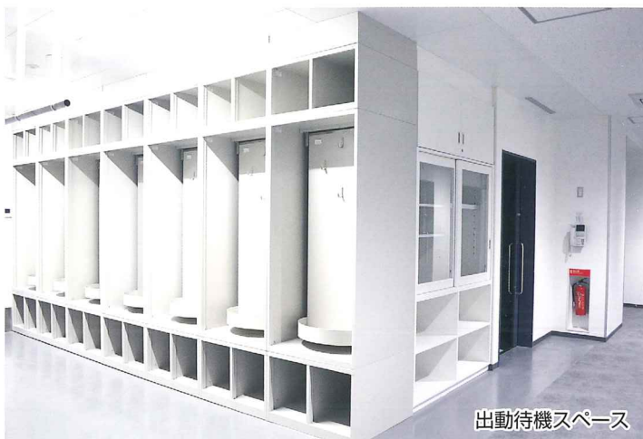
出動待機スペース