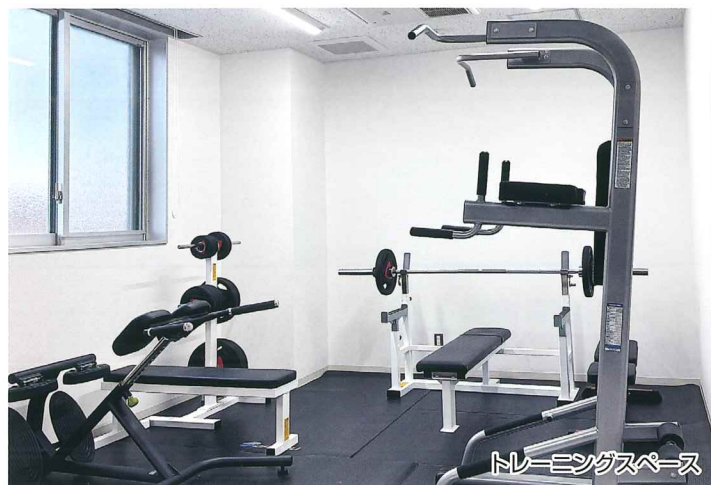
トレーニングスペース