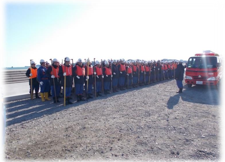
東松島市東日本大震災 行方不明者一斉搜索