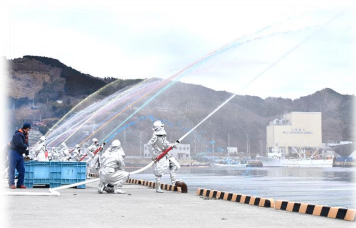
女川町消防出初式