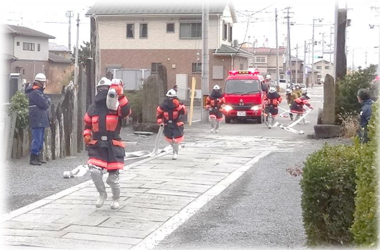
石巻市 文化財防火デー訓練