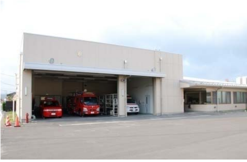
石巻消防署河南出張所