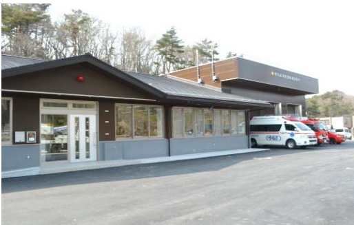
東松島消防署鳴瀬出張所

敷地面積 1,637.75 m 2 建築 昭和47年度 庁舎構造 鉄筋コンクリート造平屋建 570.62 m 2