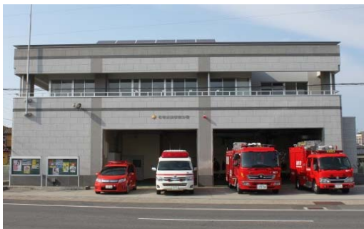
石巻消防署南分署

〒986-0805 石巻市大橋一丁目1番地1 総務課 TEL 0225-95-7111 FAX 0225-94-4637 予防課 TEL 0225-95-7167 警防課 TEL 0225-95-7433 指令課 TEL 0225-95-1304 FAX 0225-94-4636 石巻消防署 TEL 0225-95-7112 FAX 0225-94-4638 敷地面積 9,665.17 m 2 建築 平成19年度 庁舎構造 鉄筋コンクリート造3階建 3,811.75 m 2 本部車庫 鉄骨造平屋建 335.21 m 2 訓練塔 鉄筋コンクリート造4階建 (副訓練塔含む) 477.60 m 2