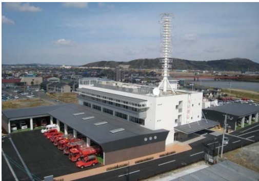
消防本部・石巻消防署

〒986-0805 石巻市大橋一丁目1番地1 総務課 TEL 0225-95-7111 FAX 0225-94-4637 予防課 TEL 0225-95-7167 警防課 TEL 0225-95-7433 指令課 TEL 0225-95-1304 FAX 0225-94-4636 石巻消防署 TEL 0225-95-7112 FAX 0225-94-4638 敷地面積 9,665.17 m 2 建築 平成19年度 庁舎構造 鉄筋コンクリート造3階建 3,811.75 m 2 本部車庫 鉄骨造平屋建 335.21 m 2 訓練塔 鉄筋コンクリート造4階建 (副訓練塔含む) 477.60 m 2