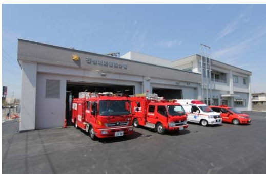
石巻消防署西分署

〒986-0874 石巻市双葉町6番27号 TEL 0225-22-2282 FAX 0225-22-7880 敷地面積 1,798.77 m 2 建築 平成20年度 庁舎構造 鉄筋コンクリート造2階建 858.17 m 2