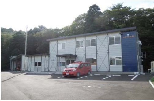
女川消防署 (仮設庁舎)