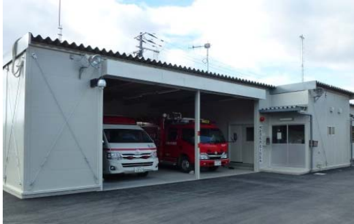
河北消防署北上出張所 (仮設庁舎)

敷地面積 3,364.73 m 2 建築 平成10年度 庁舎構造 鉄筋コンクリート造2階建 810.00 m 2