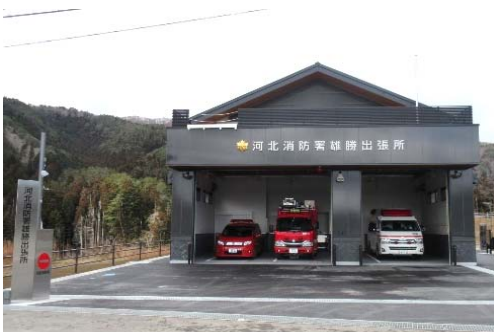
河北消防署雄勝出張所

敷地面積 930.40 m 2 建築 昭和47年度(増築 平成13年度) 庁舎構造 鉄筋コンクリート造2階建 727.24 m 2