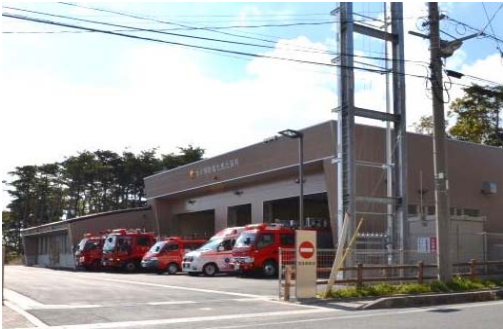
女川消防署牡鹿出張所